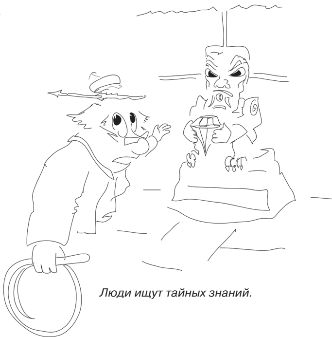
Люди ищут тайных знаний.

Существует распространённое заблуждение о том, что якобы самые главные и тайные знания надёжно спрятаны и хранятся за «семью печатями». Для сказок или фантастических историй подобное мнение очень полезно.