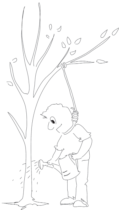
Ствол должен вырасти.

Рациональное в «картине мира» — это его ствол. Чтобы стволу вырасти нужно время. Применительно к человеку годы и десятилетия. Именно он не даёт образу в сознании индивида измениться радикально, что позволяет говорить о некоей стабильности представлений о мире каждого взрослого индивида. Однако стабильность ещё не означает «правильность» или полезность.